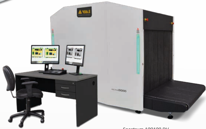
Spectrum 100100 DV

El Spectrum 100100 es proyectado específicamente para atender a las necesidades y aplicaciones de aeropuertos, prisiones, instalaciones aduaneras, operaciones de transporte, transportadoras, servicios de encomiendas o donde sea que la alta seguridad y trazabilidad total de una grande variedad de dimensiones sea necesaria.