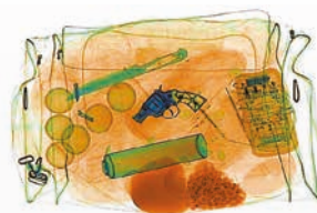
Detección de drogas