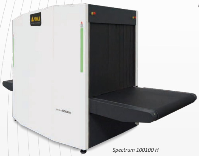
Spectrum 100100 H

Asimismo, el generador de rayos X 180kV permite alcanzar la mejor calidad de imagen en el mercado.